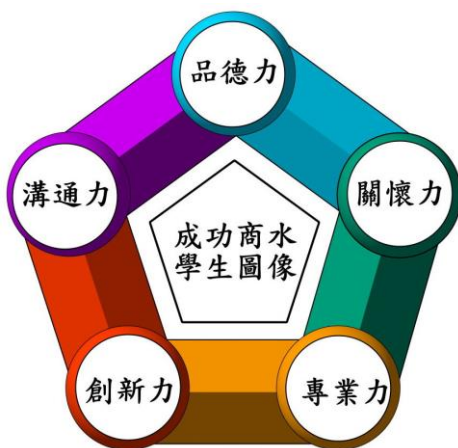
圖 2 學生圖像