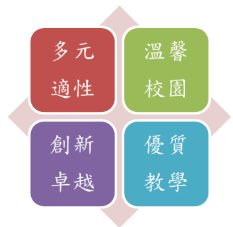
圖 1 學校願景