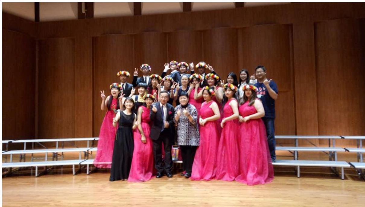
1080410善耕365-善耕商水合唱團合照