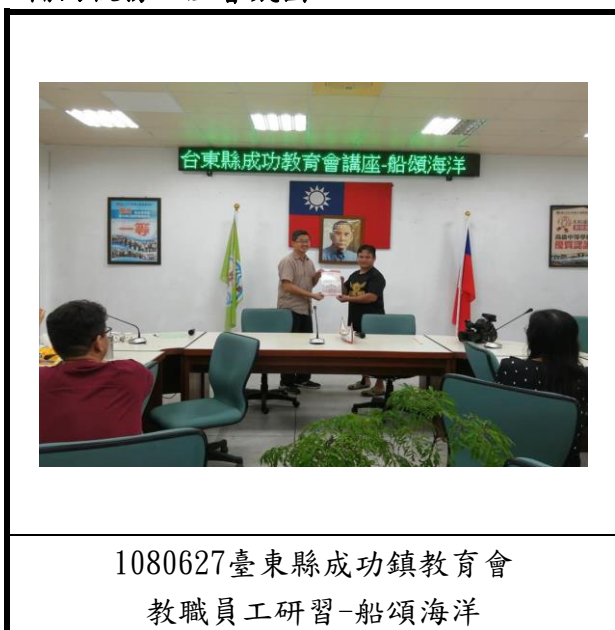
1080627臺東縣成功鎮教育會 教職員工研習-船頌海洋