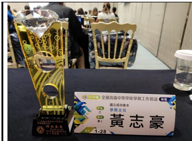
111年度資深學務主任獎盃