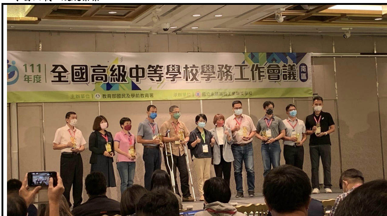
111年度資深學務主任頒獎（滿五年）