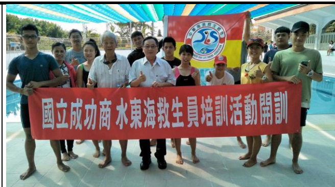
107年救生員培訓開訓