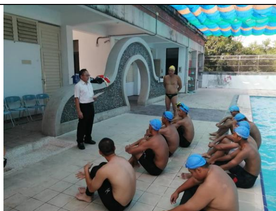
108年救生員培訓活動開訓1