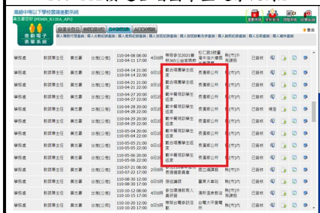
109-112接送合唱團學生返家紀錄1