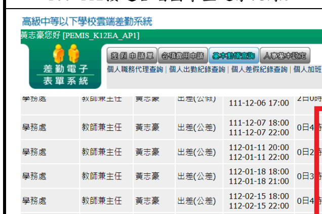
109-112接送合唱團學生返家紀錄3