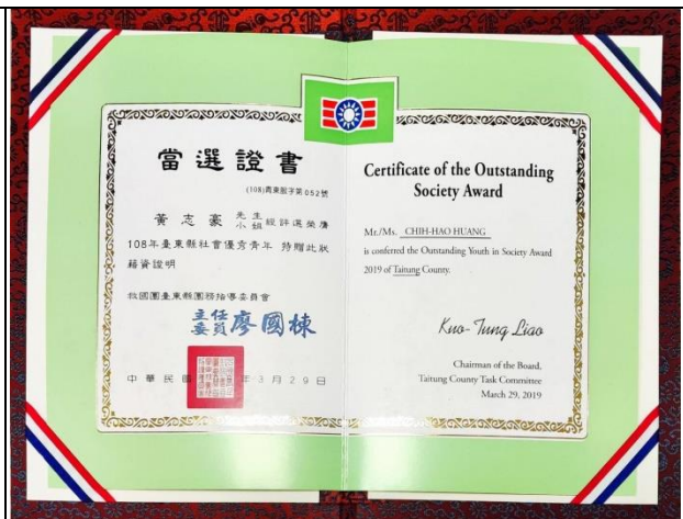
108年臺東縣社會優秀青年當選證書