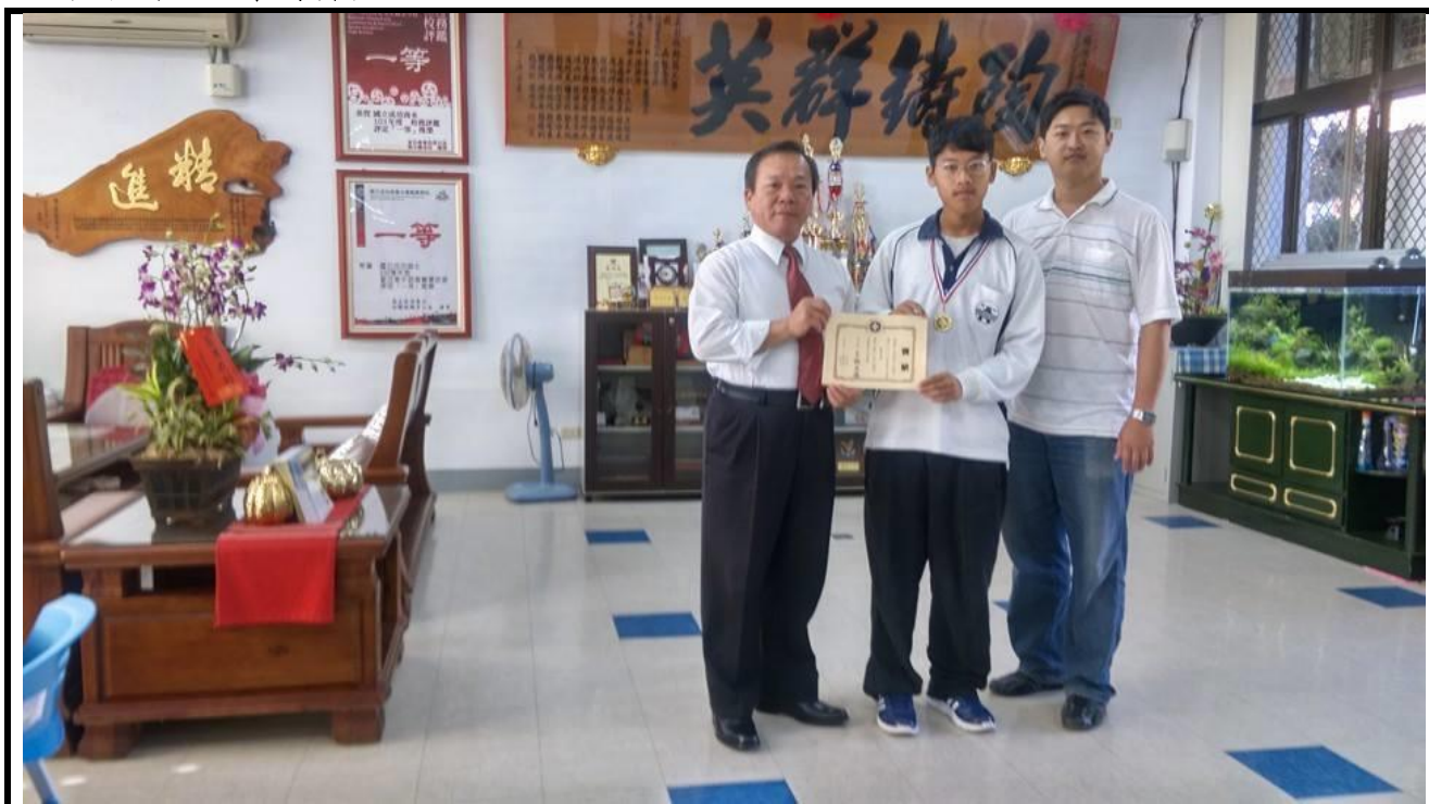
更生盃數學競試銀牌獲獎