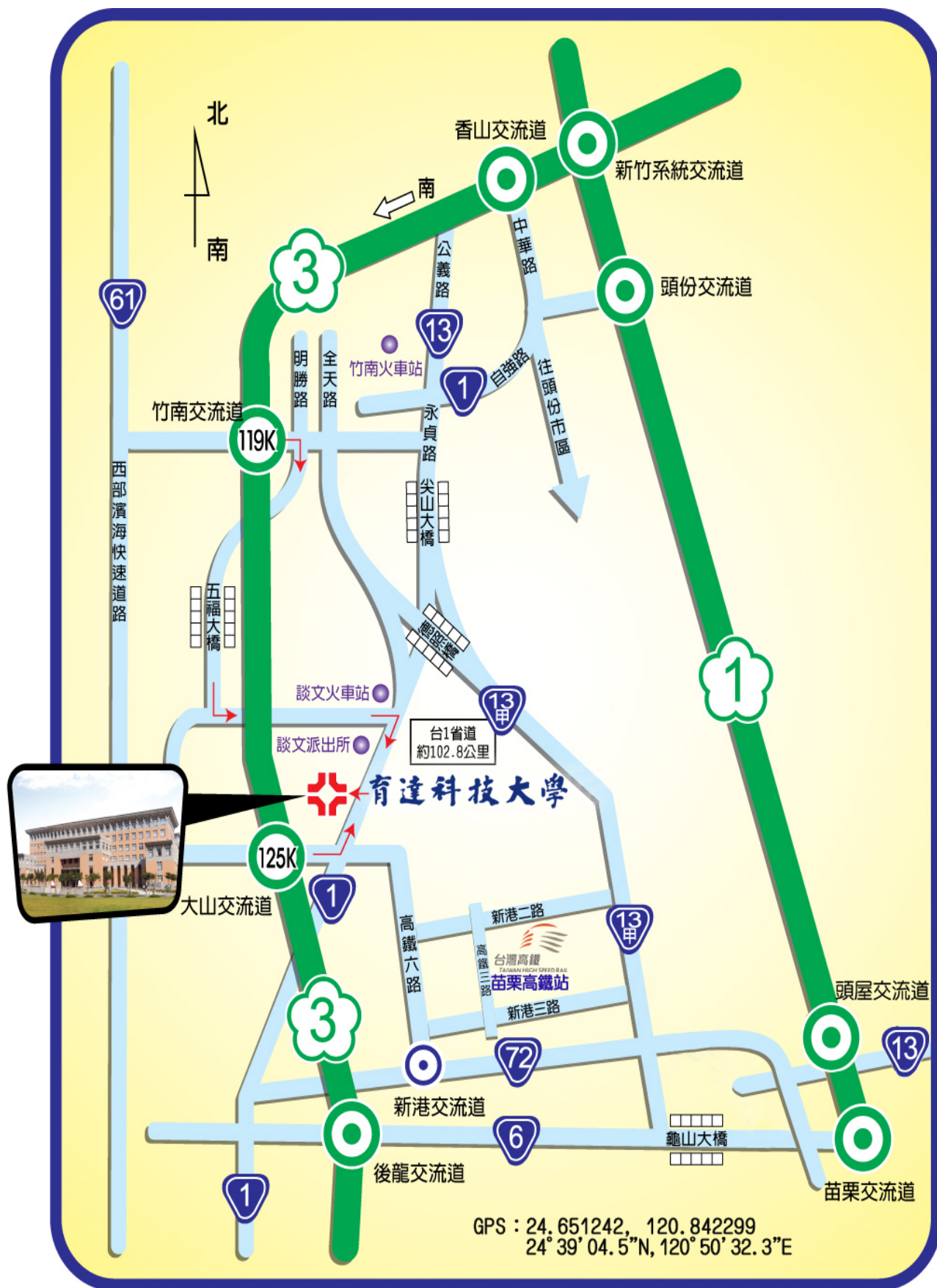
本校位置及交通路線圖