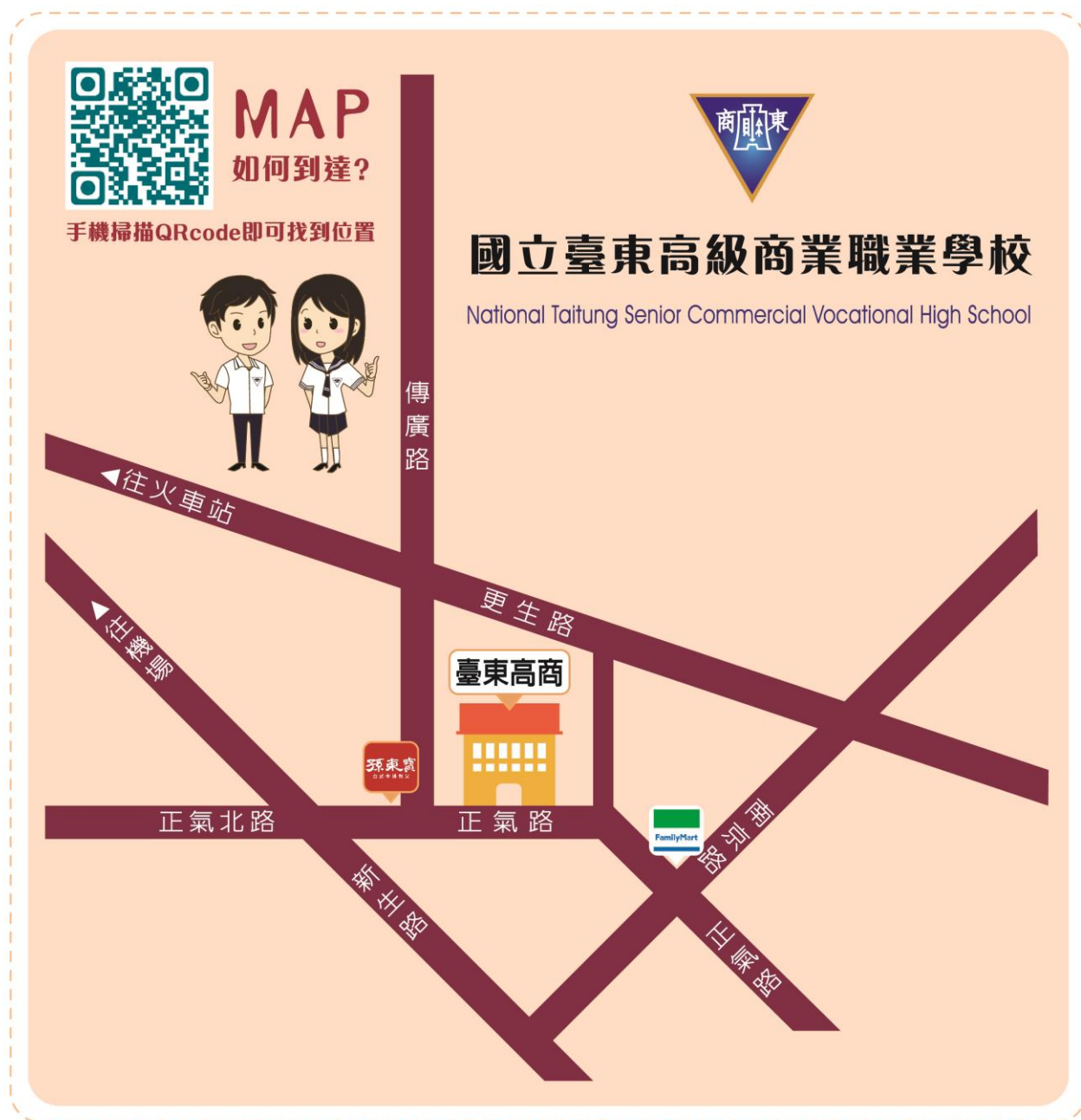
附圖一 承辦學校位置圖